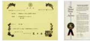
特許証(左:日本/右:アメリカ)

タフフリーコートは、常温でガラスを硬化させることのできる技術において日米特許を取得しています。シリコン系やポリマー系ではなく、正真正銘のガラスコーティング剤です。